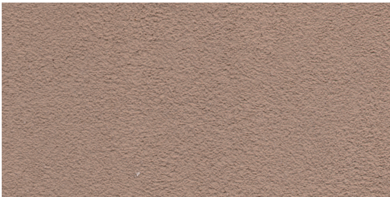
夏目漱石 - 中砂