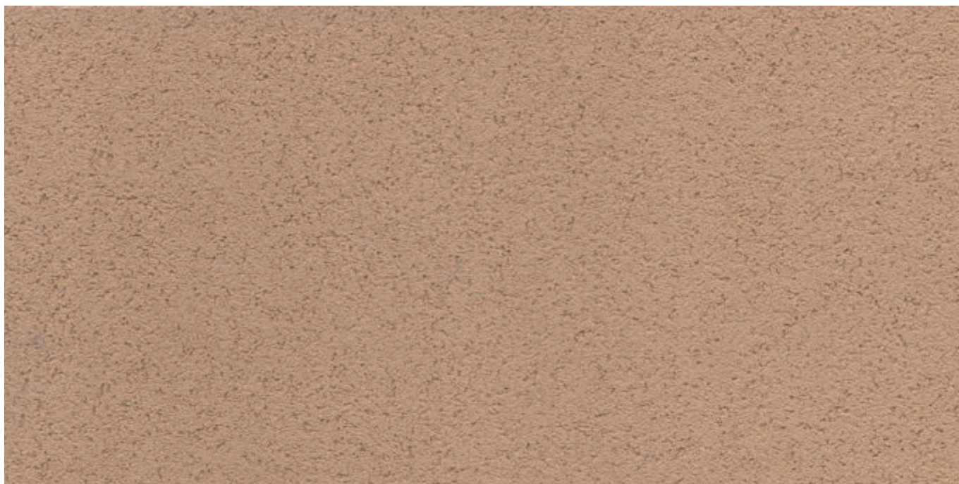
小林一茶 - 细砂

100%非合成涂料:天然黏土, 作为一种新型的室内墙面材料, 颜值高, 100%纯天然, 零VOC, 零污染