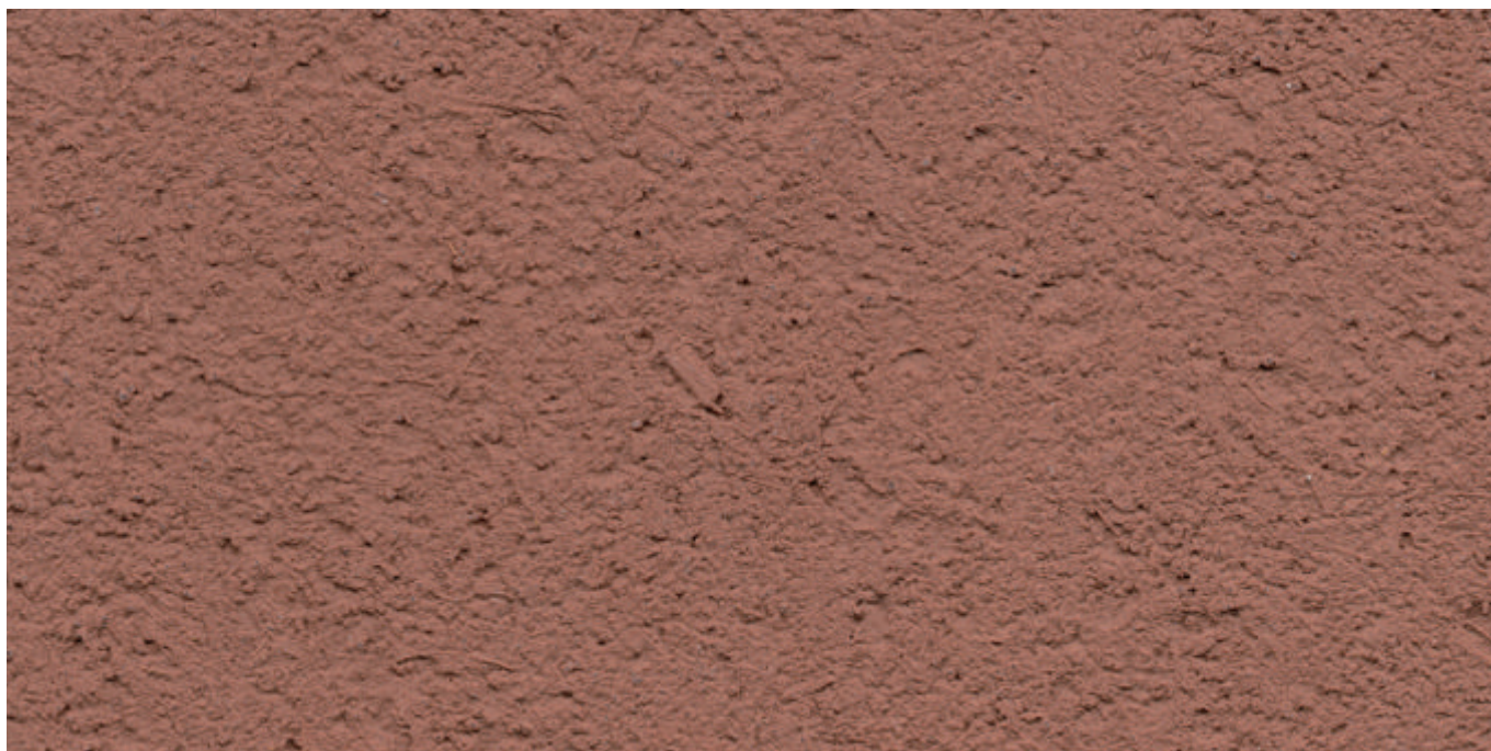
渔米之乡 - 粗砂

天然原料, 赋予了万磊天然黏土极高的生态价值 湿度的分散天然的避免了霉菌和细菌的生长, 无需额外使用化学添加剂